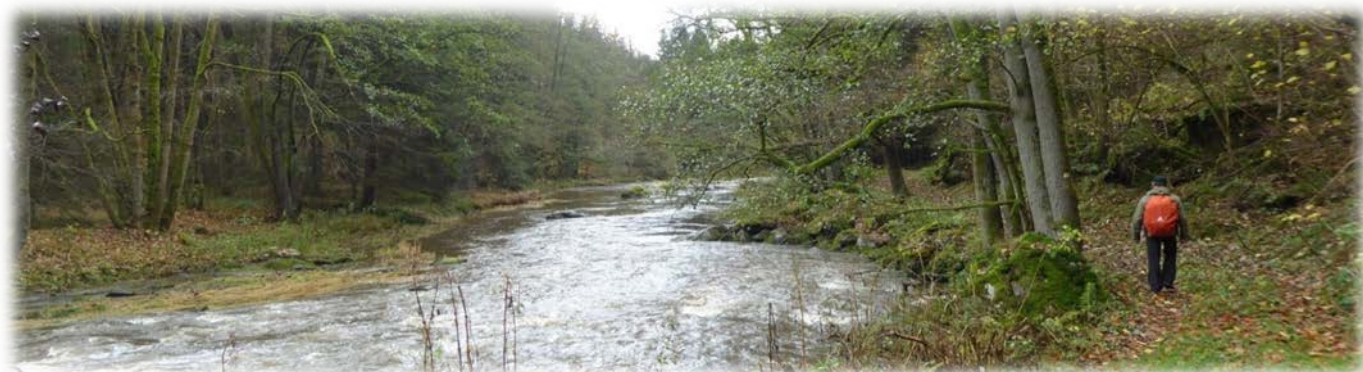
Am Pfreimdtal - Uferpfad