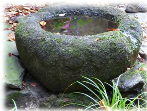
Schönbrunnen bei Hannesried